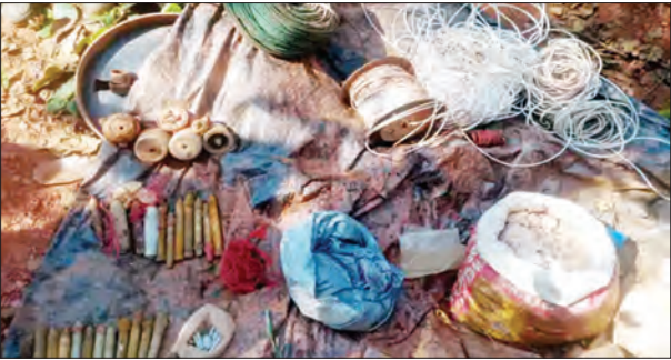
निज संवाददाता | पश्चिमी सिंहभूम

पश्चिमी सिंहभूम जिले में सुरक्षाबलों को बड़ी सफलता मिली है। प्रतिबंधित भाकपा (माओवादी) संगठन के नक्सलियों के एक पुराने डंप को सुरक्षाबलों ने नष्ट कर दिया है। यह कार्रवाई टोट्टो थाना क्षेत्र के वनग्राम जीम्कोइकीर के पास जंगली पहाड़ी इलाके में की गई। सुरक्षाबलों को गुप्त सूचना मिली थी कि नक्सली इस क्षेत्र में बड़ी मात्रा में हथियार और विस्फोटक सामग्री छिपाकर रख रहे हैं, जिसे किसी बड़ी घटना को अंजाम देने के लिए इस्तेमाल किया जा सकता है। इसी सूचना के आधार पर सच ऑपरेशन चलाया गया, जिसमें भारी मात्रा में विस्फोटक बरामद हुए।