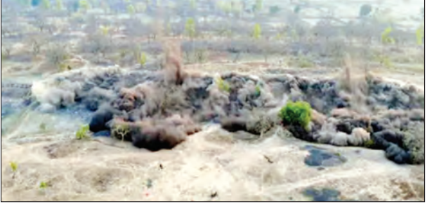
निज संवाददाता | बोकारो