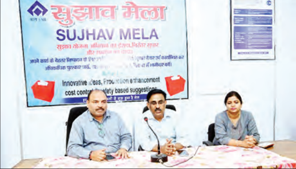
निज संवाददाता | बोकारो

बोकारो स्टील प्लांट द्वारा मार्च माह के दौरान विभिन्न विभागों में ‘सुझाव मेला’ का आयोजन किया गया। इसमें कर्मचारियों से 1,200 से अधिक सुझाव प्राप्त हुए। यह पहल कर्मचारियों को नवाचार और प्रक्रिया सुधार में सक्रिय भागीदारी के लिए प्रोत्साहित करने एवं दक्षता, सुरक्षा और उत्पादकता में वृद्धि सुनिश्चित करने के उद्देश्य से की जा रही है। अब तक बीएसएल के प्रमुख विभागों जैसे स्टील मेल्टिंग शॉप-II एवं कंटीन्यूअस कास्टिंग शॉप, कोक ओवन एवं कोल केमिकल्स, हॉट रिट्रप