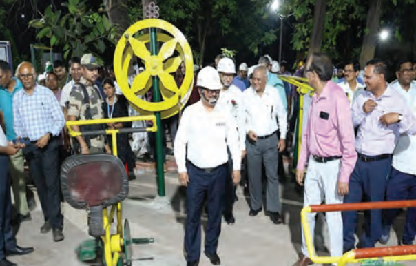
निज संवाददाता | बोकारो