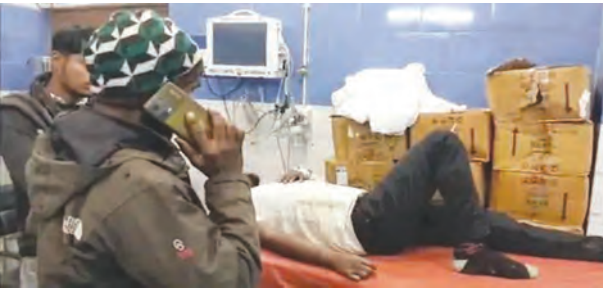
एसवीवी संवाददाता | औरंगाबाद