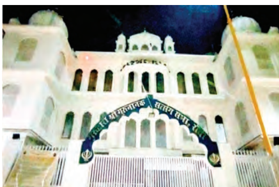
लंगर चलाया जाएगा।