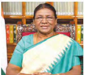
सामूहिक प्रतिबद्धता की आवश्यकता

राष्ट्रपति ने कहा कि भारत सभी नागरिकों को नागरिक और राजनीतिक अधिकारों की गारंटी देने की अपनी