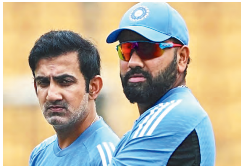
गंभीर की कोचिंग में भारत का अब तक का प्रदर्शन:

5. अब गौतम गंभीर के अंडर भारतीय टीम ऑस्ट्रेलिया दौरे पर गई है। ऑस्ट्रेलिया के खिलाफ सीरीज में भारत ने अच्छी शुरुआत करते हुए पर्थ टेस्ट में 295 रनों से जीत हासिल की। हालांकि पिंक बॉल टेस्ट में भारतीय टीम की फजीहत हो गई। ये मुकाबला तीसरे दिन के पहले सेशन में ही खत्म हो गया। इस मुकाबले में 1031 गेंदों की फेंकी गईं। ये भारत-ऑस्ट्रेलिया के बीच सबसे छोटा टेस्ट मैच रहा, जिसमें नतीजा निकला।