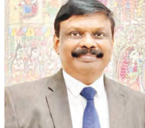
कंप्यूटर शिक्षा केवल आठवीं कक्षा तक के बच्चों को दी जाती थी, लेकिन नई योजना के तहत प्राइमरी स्तर से ही छात्रों को कंप्यूटर का प्रशिक्षण दिया जाएगा।

बिहार शिक्षा विभाग ने सरकारी स्कूलों में शिक्षकों की लापरवाही और फर्जीबाड़े पर सख्त रुख अपनाने हुए सख्त चेतावनी जारी की है। अपर मुख्य सचिव (एसीएस) एस सिद्धार्थ ने सभी जिलों के शिक्षा अधिकारियों को पत्र लिखकर कहा है कि कई शिक्षक बच्चों की उपस्थिति को लेकर फर्जी आंकड़े पेश कर रहे हैं। यह खुलासा निरीक्षण रिपोर्ट में हुआ है, जो जिला शिक्षा अधिकारियों ने तैयार की है। रिपोर्ट में यह भी बताया गया कि स्कूल के आसपास रहने वाले कई शिक्षक शिक्षण कार्य में रुचि नहीं दिखा रहे हैं। इस पर नाराजगी जताते हुए एसीएस ने कहा कि यदि इन खामियों को दूर नहीं किया गया तो दोषी शिक्षकों के खिलाफ सख्त कार्रवाई की जाएगी। शिक्षा विभाग ने बिहार में प्राथमिक और माध्यमिक शिक्षा को बेहतर बनाने के लिए कई योजनाएं तैयार की हैं। "शिक्षा की बात" कार्यक्रम में एसीएस ने कहा कि राज्य के हर प्रखंड में मोबाइल कंप्यूटर लैब स्थापित की जाएगी। यह लैब प्राथमिक स्कूल के बच्चों को डिजिटल शिक्षा से जोड़ेगी। अब तक