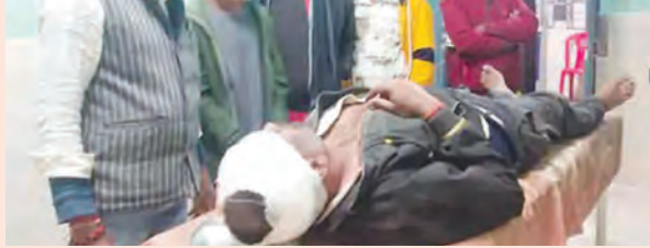
निज संवाददाता | रफीगंज औरंगाबाद

रफीगंज के चातर पेट्रोल पंप के पास अज्ञात चार पहिया वाहन की चक्करों से अनियंत्रित होकर टेम्पू पलट गई। जिसमें चालक गंभीर रूप से घायल हो गया। घायल को स्थानीय लोगों के द्वारा रफीगंज समुदायिक स्वास्थ्य केंद्र में इलाज के लिए भर्ती कराया गया।