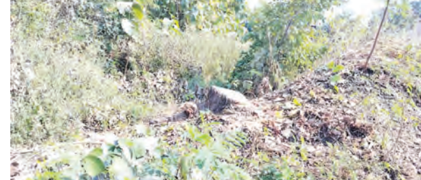
निज संवाददाता | रफीगंज (औरंगाबाद)