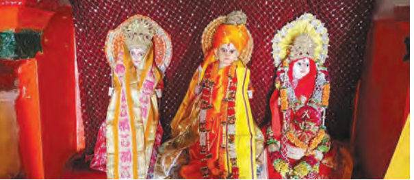
निज संवाददाता | हसपुरा (औरंगाबाद)