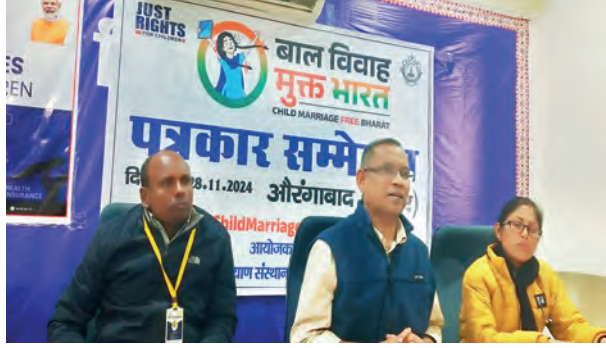
इन्होंने देव, मदनपुर, रफीगंज एवं गोह प्रखंड के पंचायत शामिल है और इन पंचायतों के मुखियों ने संगठन को यह लिख कर दिया है कि उनका पंचायत बाल विवाह मुक्त है और जब तक वह मुखिया पद पर बने रहेंगे, तब तक अपने पंचायत में कोई भी बाल विवाह नहीं होने देंगे। उन्होंने कहा कि संगठन द्वारा अपने प्रयास से 2030 तक औरंगाबाद जिले को पूरी तरह बाल विवाह मुक्त करा लिया जाएगा। कहा कि अभियान की शुरुआत के प्रथम दिन बुधवार को औरंगाबाद जिले में बाल विवाह के खिलाफ 80 जागरूकता व शायथ ग्रहण कार्यक्रम आयोजित किए गए, जिसमें समाज के हर तबके के लोग शामिल हुए।