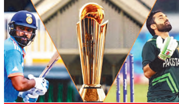
पाकिस्तान में खेलने से घबराईं टीमें

चैम्पियंस ट्रॉफी 2025 की मेजबानी पाकिस्तान क्रिकेट बोर्ड को करनी है। लेकिन अब राजनीतिक अशांति के कारण इस टूर्नामेंट का आयोजन पाकिस्तान से बाहर ट्रांसफर होने की संभावना है। श्रीलंका ए जिसे पाकिस्तान शाहीन्स के खिलाफ वनडे सीरीज में खेलना था, उसे भी इस्लामाबाद में राजनीतिक अशांति के कारण बीच में ही वापस लौटना पड़ा। एक रिपोर्ट के अनुसार चैम्पियंस ट्रॉफी में हिस्सा लेने वाले कुछ और देशों ने