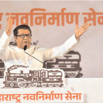
महाराष्ट्र नवनिर्माण सेना

मुंबई, एजेंसी। महाराष्ट्र विधानसभा चुनाव में क्या होगा? यह फिलहाल यक्ष प्रश्न है, लेकिन अजित पवार की पार्टी से लेकर राज ठाकरे तक का कहना है कि जो भी होगा, बेहद दिलचस्प स्थिति बनेगी। राज ठाकरे का कहना है कि कोई भी नहीं सकता कि चुनाव नतीजा क्या रहेगा। यदि आप महाराष्ट्र में घूमेंगे तो स्थिति पता चलेगी। इस साल बहुत सारी चौकाने वाली चीजें होंगी। आप 10 दिन रुक जाएँ, सब सामने ही आ जाएगा। हालांकि इस बीच राज ठाकरे ने उम्मीद जताई कि भाजपा के नेतृत्व में नई सरकार का गठन होगा और देवेंद्र फडणवीस मुख्यमंत्री होंगे।