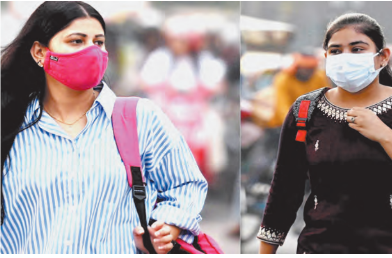
विशेषज्ञों ने कारण गिनाए और समाधान भी बताया

देहरादून, एजेंसी। देहरादून की आबोहवा अब ज्यादा प्रदूषित होने लगी है। चिंताजनक बात यह है कि यहाँ के प्रदूषण का स्तर गाजियाबाद, मेरठ और मुजफ्फरनगर जैसे शहरों से भी अधिक होने लगा है। सोमवार को केंद्रीय प्रदूषण नियंत्रण बोर्ड की रिपोर्ट के मुताबिक, देहरादून भारत के उन 258 शहरों की सूची में नौवें स्थान पर है, जहाँ वायु प्रदूषण सबसे ज्यादा है। बारिश का अभाव, हवाओं का कमजोर रुख और दूसरे प्रदेशों से आ रहा पराली के धुएँ को इसकी वजह बताया गया है। सीपीसीबी की रिपोर्ट के मुताबिक, देहरादून में सोमवार को एक्वआई 287 और ऋषिकेश में एक्वआई 208 दर्ज किया गया, जो खराब श्रेणी में आता है और लोगों के स्वास्थ्य के लिए हानिकारक है। जबकि, गाजियाबाद में एक्वआई 252, जयपुर में 237, मेरठ में 211 और मुजफ्फरनगर में 240 दर्ज किया गया। ग्रेटर नोएडा जैसी जगह भी एक्वआई 285 रहा, जो देहरादून के मुकाबले कम है।