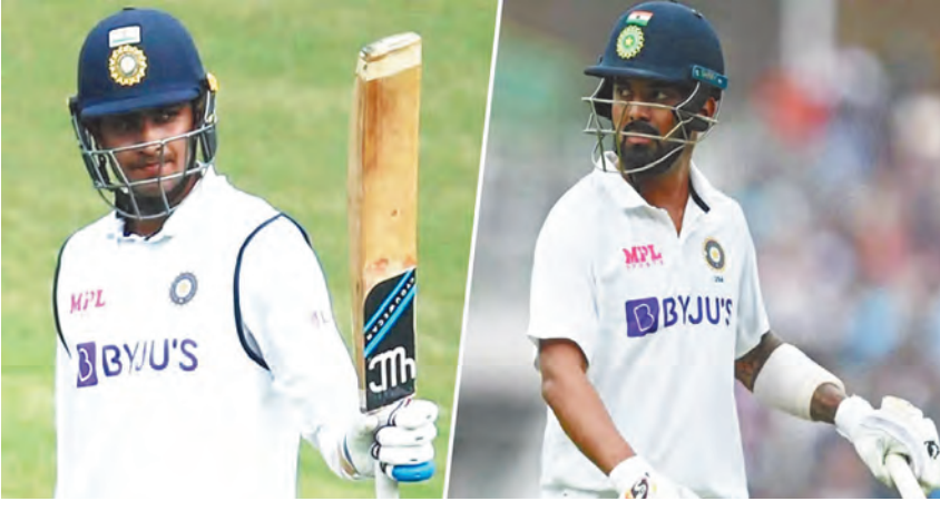
● गिल या राहुल में से किसी एक को मौका

में गिल को नंबर तीन पर खेलना था, लेकिन मैच से ठीक पहले वे इंजर्ड हो गए। उनकी जगह सरफराज खान को मौका मिला। सरफराज ने मौके का पूरा फायदा उठाते हुए सेंचुरी जमा दी। उनको अब बाहर रखना टीम मैनेजमेंट के लिए बहुत मुश्किल होगा।