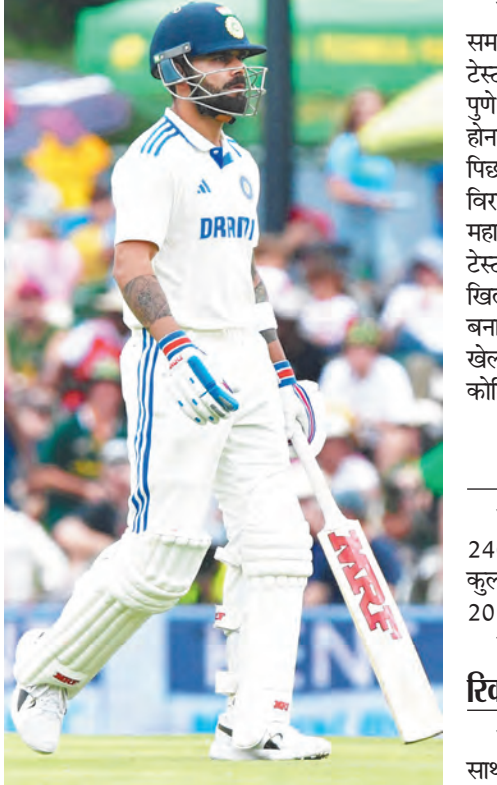
विराट कोहली का पहला टेस्ट शतक

नई दिल्ली, एजेंसी। भारतीय टीम इस समय न्यूजीलैंड के खिलाफ 3 मैचों की टेस्ट सीरीज में व्यस्त है, जहां मेजबान टीम पुणे के मैदान पर होने वाले दूसरे टेस्ट मैच होना है। अगर हम इस मैदान पर उनके पिछले प्रदर्शन पर गौर करें तो स्टार बल्लेबाज विराट कोहली पर नजरें रहेंगी। कोहली ने महाराष्ट्र क्रिकेट एसोसिएशन स्टेडियम में दो टेस्ट खेले हैं, जहां उन्होंने दक्षिण अफ्रीका के खिलाफ नाबाद 254 रन का सर्वोच्च स्कोर बनाया था। पुणे में मेहमान टीम के खिलाफ खेलते हुए कोहली कई रिकॉर्ड तोड़ने की कोशिश करेंगे।