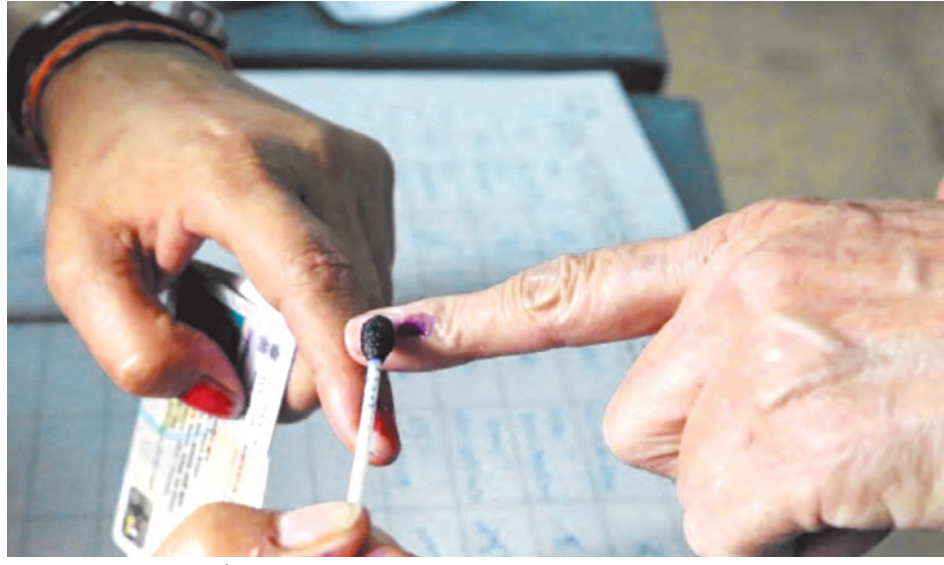
अलग-अलग वर्गों के लिए हैं। हर पद के लिए अलग-अलग रंग का बैलेट पेपर यानी मत-पत्र होगा। अध्यक्ष पद के लिए लाल रंग निर्धारित किया गया है।

बिहार में इस बार 6422 पैक्सों में चुनाव हो रहा है। पांच चरणों में चुनाव 26 नवंबर से 3 दिसंबर के बीच संपन्न होगा। इस बार भी पदों के हिसाब से अलग-अलग रंग के मतपत्र होंगे। मतपत्रों की गिनती में आसानी होने के चलते यह निर्णय लिया गया है। बिहार राज्य निर्वाचन प्राधिकार ने सभी निर्वाचन अधिकारियों को निर्देश भेजते हुए इसी हिसाब से तैयारी करने को कहा है। पैक्स में निर्देशक मंडल के कुल 12 सदस्यों के लिए चुनाव हो रहे हैं। इसमें अध्यक्ष और सचिव का पद अनारक्षित है। शेष पदों में से 50 फीसदी यानी पांच पद महिलाओं के