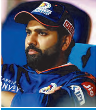
इन खिलाड़ियों को रिटेन करेगी मुंबई इंडियंस?

इससे पहले कई रिपोर्ट्स में दावा किया गया कि मुंबई इंडियंस अपने सबसे कामयाब कप्तान रोहित शर्मा को मेगा ऑक्शन से पहले रिलीज कर देगी, लेकिन अब स्पॉट्सस्टार की मानें तो रोहित शर्मा मुंबई इंडियंस के साथ बने रहेंगे। मुंबई इंडियंस अपने पूर्व कप्तान को रिटेन करेगी। इस बात पर मुंबई इंडियंस और रोहित शर्मा के बीच आपसी सहमति बन गई है।