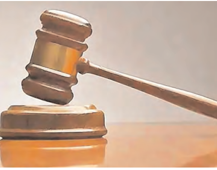
का अनुसंधान सीबीआई ने किया था।