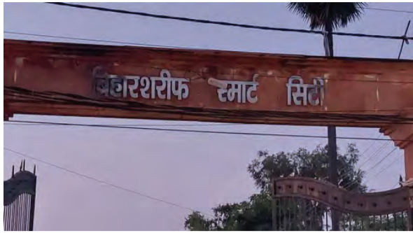
निज संवाददाता। नालंदा