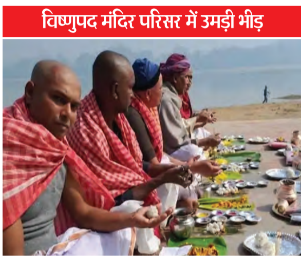
विष्णुपद मंदिर परिसर में उमड़ी भीड़

गया में पितृपक्ष मेला का आज पंचांग के अनुसार 7वां दिन है। षष्ठी व सप्तमी तिथि को मरने वाले पूर्वजों का पिंडदान किया जा रहा है। पिंडदानी तिथि के अनुसार अपने पूर्वजों को मोक्ष दिलाने के क्रम में विधि-विधान से जुटे हैं। बड़ी संख्या में तीर्थ यात्रियों के गया जी पहुंचने का सिलसिला हर दिन बना हुआ है। एक दिन, तीन दिन, सात दिन या फिर 17 दिनों की पूजा विभिन्न बेटियों के ऊपर करने में जुटा है। सप्तमी को भी विष्णुपद मंदिर के अंदर स्थित 19 बेटियों पर पिंडदान किया जा रहा। पिंडदानियों की भारी भीड़ विष्णुपद मंदिर परिसर में जुटी है। यही वजह है कि खुद डीएम और एसएसपी भीड़ को दिशा देने में जुटे हैं। सप्तमी को सूर्यपद, गणेशपद, चन्द्रपद, संध्यग्नियपद, आवसंध्याग्नियपद और दधिचिपद