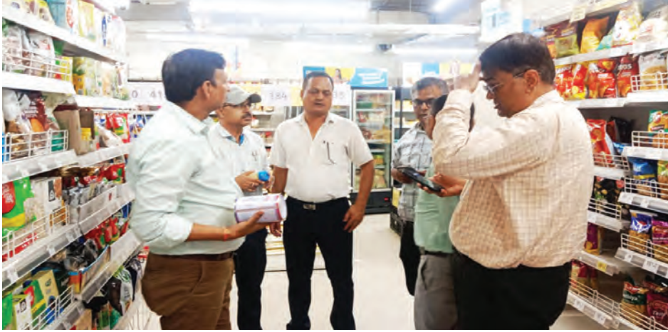
मुख्यमंत्री पुष्कर सिंह धामी ने की घोषणाएं