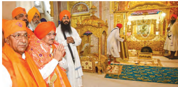
निज संवाददाता | पटना

दो दिवसीय बिहार दौरे पर आए भाजपा के राष्ट्रीय अध्यक्ष सह केन्द्रीय स्वास्थ्य मंत्री जगत प्रकाश नड्डा ने शनिवार को पटना सिटी में अनुसूचित जाति परिवार के बीच सदस्यता अभियान चलाया। मीक पर भाजपा अध्यक्ष ने कहा कि प्रधानमंत्री नरेन्द्र मोदी के नेतृत्व में भाजपा और एनडीए ने देश को आगे बढ़ाने का काम किया, दूसरी ओर विपक्षी गठबंधन के सभी घटक दलों ने भ्रष्टाचार बढ़ाया और देशविरोधी लोगों को ताकत प्रदान की। कहा कि भाजपा देश की एकमात्र पार्टी है, जहां प्रधानमंत्री से लेकर केन्द्रीय मंत्री तक, राष्ट्रीय अध्यक्ष से लेकर प्रदेश अध्यक्ष तक और जिलाध्यक्ष से लेकर मंडल अध्यक्ष तक, पार्टी के सभी कार्यकर्ताओं और पदाधिकारियों को छह वर्षों बाद अपनी सदस्यता