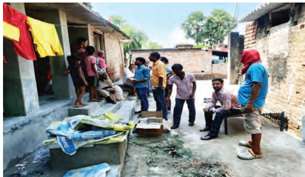
निज संवाददाता | कौआकोल (नवादा)

प्रखण्ड के नावाडीह पंचायत के नीमडीह टोला में डायरिया के कहर से कई ग्रामीण आक्रांत हैं। जिनका ईलाज गांव में ही स्वास्थ्य विभाग द्वारा कैम्प लगाकर किया जा रहा है। प्राप्त जानकारी के अनुसार नावाडीह पंचायत के नीमडीह मुस्लिम टोला में लगभग पिछले एक-दो दिनों में