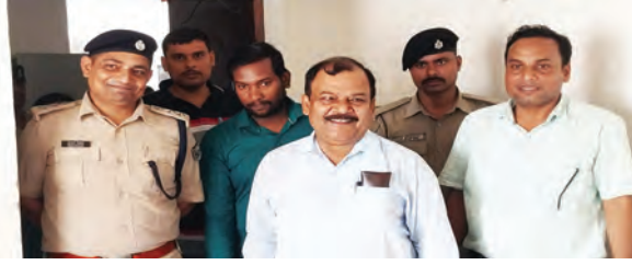
निज संवाददाता | नवादा

जिलाधिकारी ने आज वृहद आश्रय गृह बुधौल और पर्यवेक्षण गृह का औचक निरीक्षण किया। इस निरीक्षण के दौरान जिला निरीक्षण समिति ने नवादा के बाल देख-रेख संस्थान, विशिष्ट दत्तक ग्रहण संस्थान और वृहद आश्रय गृह का मूल्यांकन किया। निरीक्षण के दौरान आवासन, स्वास्थ्य, सुरक्षा और खान-पान की व्यवस्था की