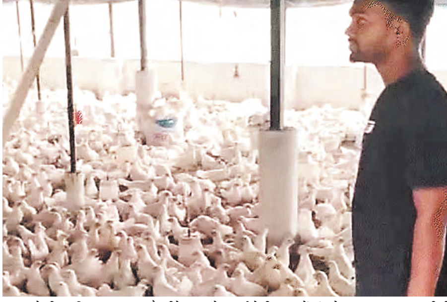
स्टाफ को भी रख लिया, दाना, दवा, वैक्सिनेशन करने लगे।

मोबाइल पर नए-नए बिजनेस का आइडिया देख रहे थे। तभी एक दिन यूट्यूब पर अंडा के धंधा के संबंध में देखा। इसके बाद लगातार यूट्यूब पर देखने लगे कि आखिर यह धंधा कैसे हो सकता है। पास में अधिक पैसे नहीं थे, पिता गालिब शाहीन ने 9 कड़ जमीन बेची, कुछ पैसे पास में थे। कुल मिलाकर 35 लाख की लागत से धंधा शुरू कर दिया। पहली बार 5300 चूजे बेनकीज की कंपनी के हेचरी से लिए। सभी मिलकर चूजा को मुर्गा बनाने और उससे अंडा उत्पादन पर ध्यान देने लगे। दो