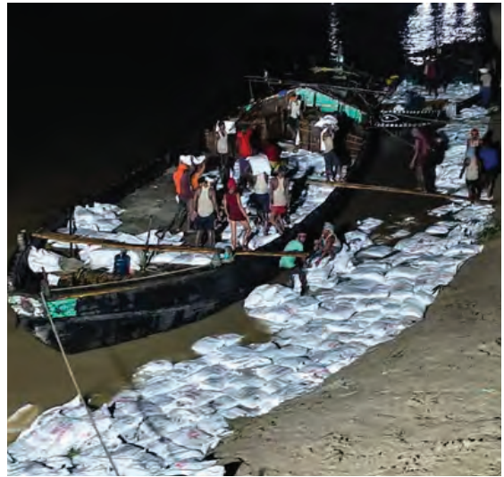
निज संवाददाता। भागलपुर

भागलपुर में नवगछिया के इस्माइलपुर प्रखंड के बिंद टोली स्थित रिंग बांध मंगलवार को ध्वस्त हो गया था। पिछले दो दिनों से जिला प्रशासन और जल संसाधन विभाग के अधिकारियों ने लगातार इसके लिए युद्ध स्तर पर मरम्मती का काम किया है। तटबंध से पानी के बहाव पर लगभग काबू किया गया है। यह जानकारी सूचना जनसंपर्क पदाधिकारी नागेंद्र कुमार ने गुरुवार की रात 11 बजे दी है। फिलहाल, 10 हजार लोग इससे प्रभावित हैं। किचन चलाकर बाढ़ प्रभावित लोगों को भोजन-सूचना जनसंपर्क पदाधिकारी ने बताया कि गोपालपुर के महिपाल राजकीय उच्च बुनियादी स्कूल तीन टंगा गोपालपुर और जगदंबा कन्या विद्यालय गोपालपुर के साथ-साथ सैटपुर में सामुदायिक किचन चलाकर बाढ़ प्रभावित लोगों को भोजन कराया जा रहा