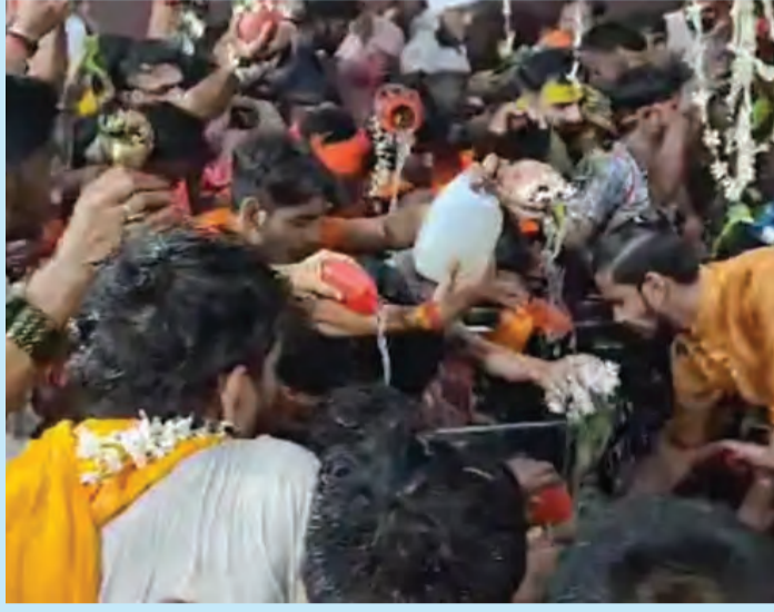
अभी तक 20 हजार श्रद्धालु जलाभिषेक कर चुके हैं। बक्सर के रामेश्वर नाथ मंदिर में भी उमड़ी भीड़: रामेश्वर मंदिर में भी सुबह से ही भक्तों की जलाभिषेक के लिए तांता लगा हुआ है। यह मंदिर रामेश्वर घाट

ब्रह्मेश्वर नाथ मंदिर में 500 मीटर तक लगी लंबी कतार: बक्सर जिला मुख्यालय से लगभग 40 किलोमीटर की दूरी पर स्थित बाबा ब्रह्मेश्वर नाथ मंदिर में अहले सुबह तीन बजे से शिव भक्तों की लंबी कतार देखने को मिल रही है। यहां जलाभिषेक के लिए लगभग 500 मीटर लंबी लाइन लगी हुई है। मौके पर मौजूद पुलिस बल भक्तों को कतार में करने के साथ मंदिर के गर्भ गृह में सीमित संख्या के साथ भेजा जा रहा है। बता दें कि ब्रह्मपुर धाम स्थित बाबा ब्रह्मेश्वर नाथ मंदिर में जल चढ़ाने के लिए यूपी, बिहार, झारखंड के विभिन्न जिले से लोग पहुंचते हैं। प्रसिद्ध रामेश्वर घाट पर कांवर की पूजा अर्चना कर रहा है। इसको लेकर मंदिर प्रबंधन द्वारा यात्रा पूरी कर पहुंचते हैं। बताया गया कि