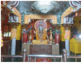
बाबा की समाधि पर लंगोट चढ़ाकर मस्ते में मंगी जाती, प्रसाद का भी किया जाता वितरण

बिहार के प्रसिद्ध धार्मिक और सांस्कृतिक आयोजन 'लंगोट मेला' की तैयारियां हो रही हैं। सात दिवसीय मेला, जो बाबा मणिराम की समाधि पर आयोजित होता है, इस वर्ष 21 जुलाई से शुरू होगा और 28 जुलाई को समाप्त होगा। बिहार शरीफ के दक्षिण-पूर्वी कोने में स्थित बाबा मणिराम का अखाड़ा, हर वर्ष आषाढ़ गुरु पूर्णिमा से लेकर सात दिनों तक