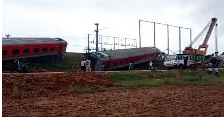
कार्य कर रहे हैं।

दुर्घटनाग्रस्त 12810 अप हावड़ा-मुंबई मेल के डब्बों को रेल पटरियों से हटाने का कार्य जारी है। इस कार्य में रेलवे के अधिकारियों से लेकर कर्मियों तक को लगाया गया है। चक्रधरपुर व बंडोमुंडा से उच्च क्षमता वाले क्रेन लाकर दुर्घटनाग्रस्त रेल के डब्बों के साथ साथ मलवा को हटाने का कार्य जारी है। समाचार लिखे जाने तक इस दुर्घटनाग्रस्त ट्रेन के 16 डब्बों को रेल पटरियों से हटाया जा चुका है। इंजन समेत अन्य डब्बों को हटाने का कार्य जारी है। राहत कार्य में अधिकारी से लेकर कर्मियों तक आपसी समन्वय बनाकर