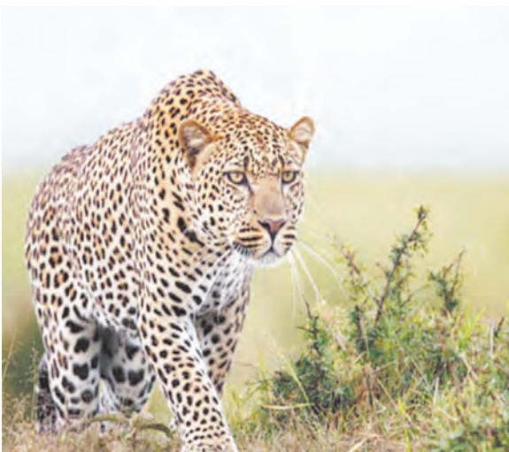
अरावली से सटे गांव टिकली में तेंदुआ दिखने से ग्रामीण दहशत में