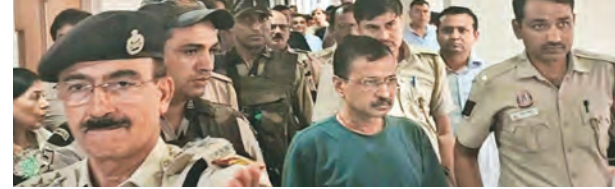
एजेंसी | नयी दिल्ली

अबकारी नीति घोटाला मामले में सीबीआई ने बुधवार (26 जून) को दिल्ली के मुख्यमंत्री अरविंद केजरीवाल ने राज उखेचू कोर्ट में पेश किया। कोर्ट से अनुमति के बाद जज एजेंसी ने केजरीवाल को गिरफ्तार कर लिया। इसी मामले में सीबीआई ने केजरीवाल की पांच दिन की रिमांड मांगी है, जिस पर कभी भी फैसला आ सकता है। इससे पहले सीएम को ईडी ने मनी लॉड्रिंग मामले 21 मार्च को गिरफ्तार किया था, फिलहाल केजरीवाल न्यायिक हिरासत में तिहाड़ जेल में थे।