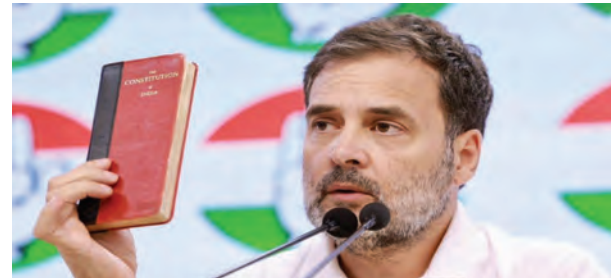
विपक्ष को सदन में आवाज उठाने का मिले मौका

पिछले दो लोकसभा में कांग्रेस की ओर से नेता सदन मल्लिकार्जुन खरोगे और अधीर रंजन चौधरी ने। अब जब राहुल गांधी नेता विपक्ष बन गए हैं तो देश में होने वाली अहम नियुक्तियों में उनकी राय अहम होगी।