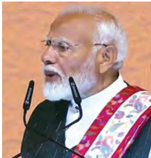
तहर तैयार हैं।

पीएम ने कहा कि भारतीय नागरिक सुरक्षा संहिता, 2023, भारतीय न्याय संहिता, 2023 और भारतीय साक्ष्य अधिनियम, 2023 का पारित होना हमारे इतिहास में एक महत्वपूर्ण क्षण है। ये विधेयक औपनिवेशिक युग के कानूनों के अंत का प्रतीक हैं। सार्वजनिक सेवा और जनकल्याणकारी कानूनों से एक नये युग की शुरुआत हुई है। सूत्रों के अनुसार गृह मंत्रालय ने नए आपराधिक कानूनों को लागू करने के लिए राज्यों और केन्द्र शासित प्रदेशों के साथ नियमित बैठकें की हैं। राज्यों और केन्द्रशासित प्रदेश नए आपराधिक कानूनों को लागू करने के लिए प्रौद्योगिकी, क्षमता निर्माण और जागरूकता पैदा करने के मामले में पूरी