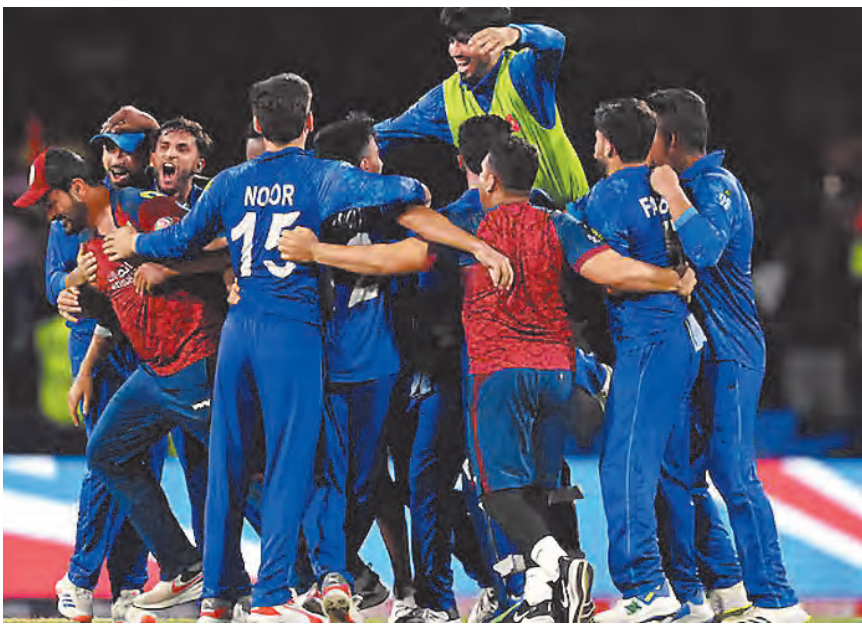
टी-20 वर्ल्डकप: अफगानिस्तान ने किया बड़ा उलटफेर