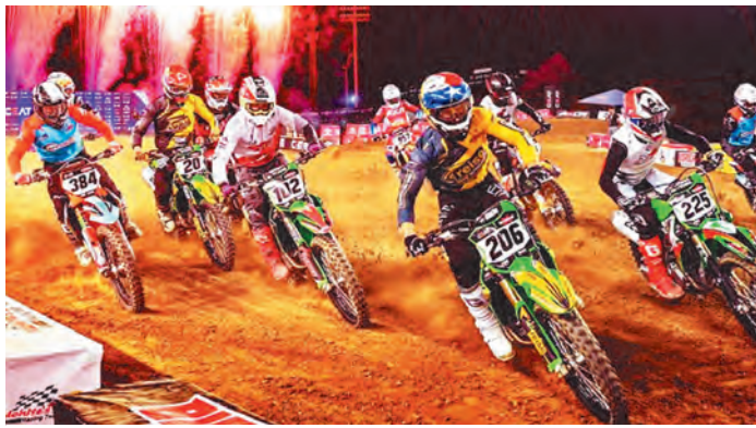
इंडियन सुपरक्रॉस रेसिंग लीग

इससे पहले दीपिका कुमारी, भजन कौर और अंकिता भक्त की भारतीय महिला रिकर्व टीम शुक्रवार को प्री-क्वार्टर फाइनल में निचली रैंकिंग वाले यूक्रेन से 3-5 से हार के बाद कोटा हासिल करने में असफल रही। महिला टीम अभी भी पेरिस ओलंपिक की कट-ऑफ तारीख से पहले अपनी रैंकिंग के आधार पर क्वालिफाई कर सकती हैं।