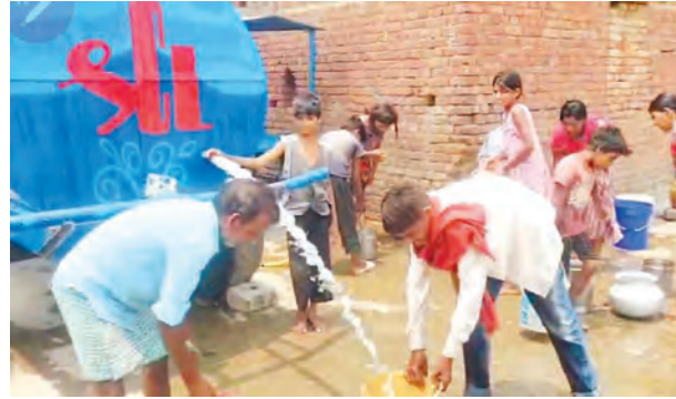
समाजसेवा में भी अग्रणी श्री सीमेंट

पानी के टैंकों से बुझ रही लोगों की प्यास कार्यालय संवाददाता