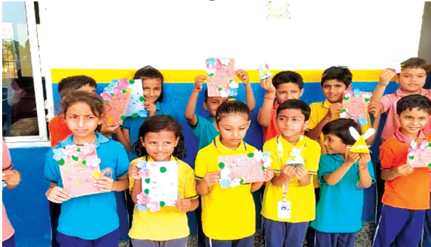
दौरान इस तरह के आयोजन से ना केवल बच्चों को बहुत कुछ नया सीखने का अवसर मिला बल्कि विभिन्न गतिविधियों से उनके भीतर छुपी प्रतिभा का प्रदर्शन करने का अवसर भी सभी को मिला।