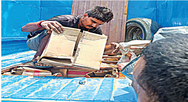
रास्ते हिंसुआ थाना क्षेत्र के हदसा गांव की ओर ले जाती जा रही है। सूचना के आलोक में छापामार दल का गठन कर आने वाले वाहनों पर निगरानी आरंभ कर दी गयी। पारकुरहा तिमहानी के पास सिल्वर