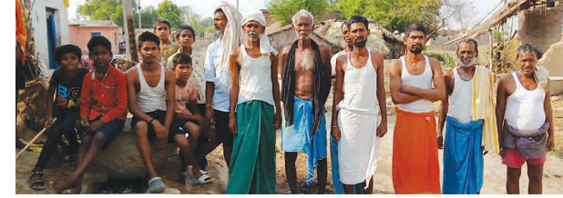
यया कहते हैं अधिकारी?

गोह (औरंगाबाद)। लोकसभा चुनाव 2024 के सातवें चरण के लिए काराकाट लोक सभाक्षेत्र में सुबह सात बजे से ही गोह विधान सभा के सभी गांव में शांति पूर्ण मतदान शुरू हो गया था, लेकिन देवहरा पंचायत के शेखपुरा एवं घेजना गांव के ग्रामीणों ने रोड नहीं तो वोट नही के नारे के साथ वोट का बहिष्कार किया।