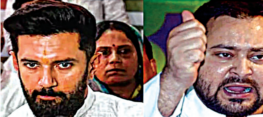
लोगों की जमीनों हथियाई जाती थीं। कैसे दुकानों को तोड़कर सामानों को हथिया लिया जाता था। चिराग ने आगे कहा कि 90 के दशक में मेरे छोटे (तेजस्वी यादव) भाई काफी छोटे रहे होंगे, इसलिए उन्हें

निज संवाददाता पटना। आखिरी चरण के मतदान को लेकर चिराग पासवान काफी एक्टिव हैं। उन्होंने बुधवार को जगह-जगह पर चुनावी सभा की। इसके मीडिया के सामने बिहार के पूर्व डिप्टी सीएम तेजस्वी यादव के बारे में ऐसी बात कह दी, जिससे राजनीति तेज हो गई है। उन्होंने कहा कि आपके (तेजस्वी यादव) ऊपर तो पहले से ही केस चल रहा है, कोर्ट में लैंड फॉर जॉब नाम से केस चल रहा है। ये बात किसी से छुपी नहीं है कि 90 के दशक में क्या क्या चीजें होती थीं, कैसे