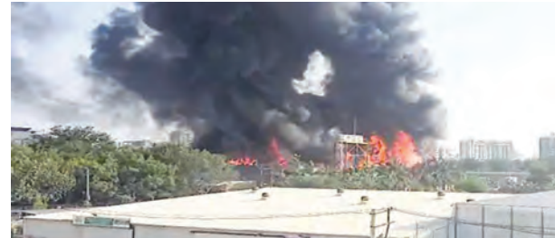
एजेंसी | राजकोट (गुजरात)

गुजरात के राजकोट शहर के कालावड रोड पर स्थित टीआरपी गेम जोन में शनिवार शाम 5.30 बजे भीषण आग लग गई। हादसे में 12 समेत बच्चे समेत 24 लोगों की मौत हो गई। प्रशासन का कहना है कि मरने वालों की संख्या बढ़ सकती है। मृतकों के शव इतनी बुरी तरह झुलसे हैं कि उनकी शिनाख्त नहीं हो सकी है। पहचान के लिए डीएनए टेस्ट किया जाएगा। अभी प्रशासन यह नहीं बता पाया है कि आग लगने के वक्त गेम जोन में कितने लोग मौजूद थे। आग पर 3 घंटे में काबू पाया गया। फायर ब्रिगेड से मिली जानकारी के अनुसार, पूरा गेमजोन जलकर खाक हो गया। अब तक 25 से ज्यादा लोगों को सुरक्षित बाहर निकाला जा चुका है।