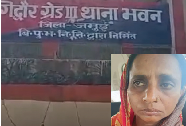
मामले के संदर्भ में बताया गया कि दिल्ली में बेशकीमती सामान, जेवरत आदि की चोरी हुई थी। इस घटना के बाद वहां की क्राइम ब्रांच दिल्ली पुलिस की निशानदेही पर अनुसंधान करते हुए गिद्धरी थाना पहुंची। यहां गिद्धरी थाना क्षेत्र अंतर्गत

थाना से जुड़े सूत्रों ने बताया कि दिल्ली में दर्ज कांड संख्या 220/24 धारा 38/411/34 में उक्त महिला की तलाश थी।