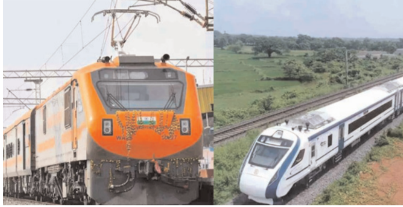
और वंदे भारत (स्लीपर वर्जन) का भी पूर्व मध्य रेलवे क्षेत्राधिकार से परिचालन होगा। रेलवे के

इसको लेकर आधिकारिक अधिसूचना जल्द जारी की जा सकती है। फिलहाल, इस रूट पर ट्रेक की स्पीड 130 किलोमीटर प्रति घंटा करने की कवायद चल रही है। इसके मई के अंत तक पूरा होने की उम्मीद है। स्पीड बढ़ाने को लेकर जारी रेल पथ मरम्मत का काम भी पूरा होने वाला है। वंदे भारत के अलावा अमृत भारत एक्सप्रेस