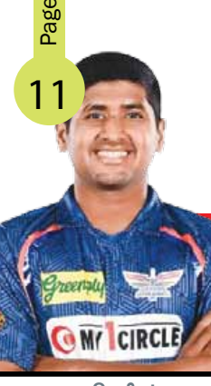
शुक्ल पक्ष अश्विनी संवत् 2081