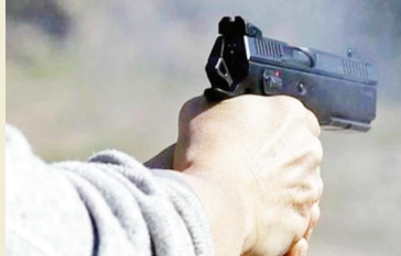
रुपए लूट लिया। बाद में उन्हें भी वाशरूम में बंद कर डकैत बैंक से बाहर निकले व बाइक पर