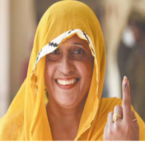
सांसद होने का गौरव कमला चौधरी के ही नाम है। कमला चौधरी 1962 में चुनाव जीतकर सांसद बनीं थीं। सबसे पहला चुनाव 1957 में हुआ तब गाजियाबाद सीट हापुड़ लोकसभा के नाम से हुआ करती थी। 1957 में हुए

शुरुआती दौर से ही गाजियाबाद सीट पर पहले कांग्रेस और फिर भाजपा का दबदबा रहा है, जो अभी तक कायम है। इन 16 चुनावों में से सिर्फ एक बार ही कांग्रेस की कमला चौधरी ने भारतीय संसद में बतौर सांसद गाजियाबाद का प्रतिनिधित्व किया है। भाजपा के अलावा कई दलों ने महिलाओं को लोकसभा चुनाव मैदान में उतारा, मगर किसी को भी जीत नसीब नहीं हुई। गाजियाबाद से पहली और अबतक की आखिरी महिला