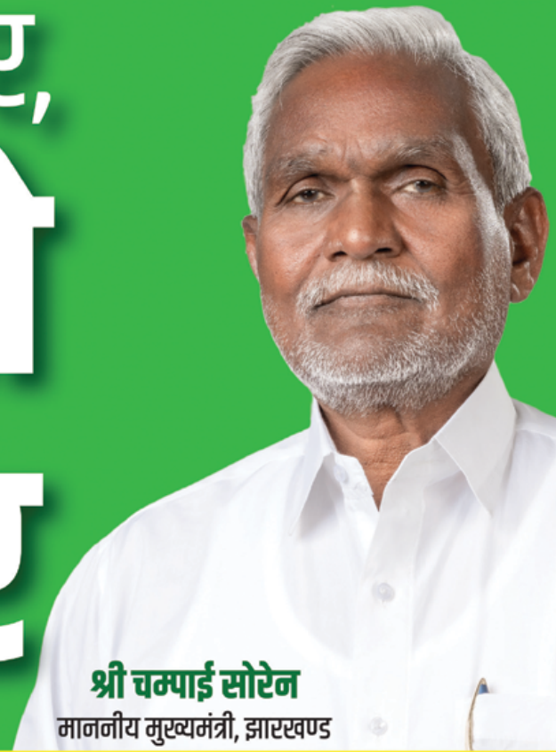
श्री चम्पाई सोरेन माननीय मुख्यमंत्री, झारखण्ड