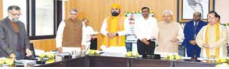
कैमूर जिले के तीन प्रखंडों में बनेगे तीन छात्रावास

मुख्यमंत्री नीतीश कुमार ने गुरुवार को 'संकल्प' में भवन निर्माण विभाग एवं बिहार राज्य भवन निर्माण निगम द्वारा क्रियान्वित 132 विभागों की 1555.30 करोड़ रुपये की 132 योजनाओं का रिमोट के माध्यम से उद्घाटन किया एवं 16 विभागों के 1321.13 करोड़ रुपये की 110 योजनाओं का शिलान्यास किया। उल्लेखनीय है कि मुख्यमंत्री नीतीश कुमार के नेतृत्व एवं मार्गदर्शन में राज्य में कई आर्थिक बिल्डिंग्स बनाए गए हैं। बिहार संग्रहालय, सम्राट अशोक कन्वेंशन केंद्र, सरदार पटेल भवन, महाबोधि संस्कृतिक केंद्र गया, बिहार सदन नई दिल्ली, प्रकाश पुंज, आन एवं विज्ञान संग्रहालय दरभंगा, 2000 क्षमता के मोतिहारी एवं बेतिया में सभाभवन, प्रशासनिक प्रशिक्षण केंद्र गया, नियोजन भवन, ओपी साह सांस्कृतिक भवन, बापू परीक्षा परिसर, वरीय पदाधिकारी आवास, परिवहन परिसर जैसे कई महत्वपूर्ण भवनों का निर्माण पूर्ण किया गया है। इसके साथ-साथ मुख्यमंत्री सात निश्चय योजना के तहत आज बक्सर अभियंत्रण