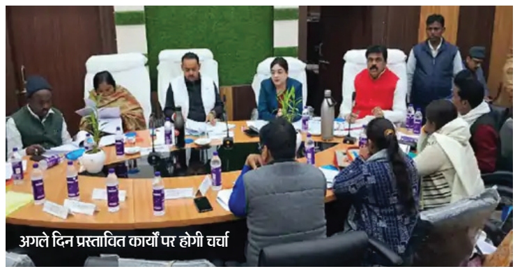
अगले दिन प्रस्तावित कार्यों पर होगी चर्चा

गया नगर निगम की सशक्त स्थाई समिति की बैठक मंगलवार को साढ़े 11 बजे से शुरू होगी। बैठक में वर्ष 2024-25 का बजट पास किया जाएगा। पहले बजट चर्चा होगी। उसके बाद उसे सर्वसहमति से पास किया जाएगा। बजट पास होने के अगले दिन फिर बैठक होगी। जिसमें विकास से जुड़े 20 बिंदुओं पर चर्चा होगी। उन सभी 20 बिंदुओं से जुड़े विकास कार्य की समीक्षा की जाएगी। इसके अलावा नगर निगम द्वारा सदन में प्रस्ताव के लिए लाये कार्यों की समीक्षा और अनुमोदन किया जाएगा। साथ ही विकास के कार्यों को आगे बढ़ाने का नगर हित में फैसला लिया जाएगा। दरअसल, लोकसभा चुनाव की तिथियों की घोषणा आने वाले दिनों में होने वाली है। इसे देखते हुए नगर निगम बजट को लेकर किसी