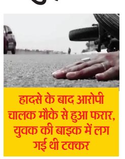
हादसे के बाद आरोपी चालक मौके से हुआ फरार, युवक की बाइक में लग गई थी टक्कर

गया जिले के अतरी थाना क्षेत्र के सरबहदा ओपी क्षेत्र के खाड़ि गांव के समीप पिकअप और बाइक सवार की हुई टक्कर में बाइक सवार की मौके पर ही जान चली गई। टक्कर मारने वाला पिकअप ड्राइवर वाहन समेत मौके से फरार हो गया है। घटना मंगलवार की रात की है। युवक की पहचान कर ली गई है। वह पास के ही गांव का रहने वाला है। घटना की सूचना मृतक के घर वालों को दी गई है। सरबहदा ओपी की पुलिस घटना की छानबीन में जुट गई है।