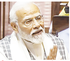
बिजली बनाकर कमाई करेंगे