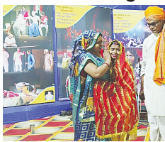
निज संवाददाता | खगौल (पटना)