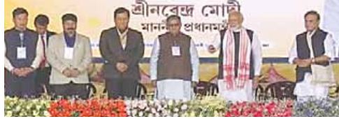
रखी कामाख्या मंदिर कॉरिडोर की आधारशिला

पीएम मोदी की पूर्वोत्तर यात्रा महत्वपूर्ण है क्योंकि यह क्षेत्र की विकास संबंधी जरूरतों के प्रति