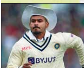
इंडिया वर्से इंग्लैंड