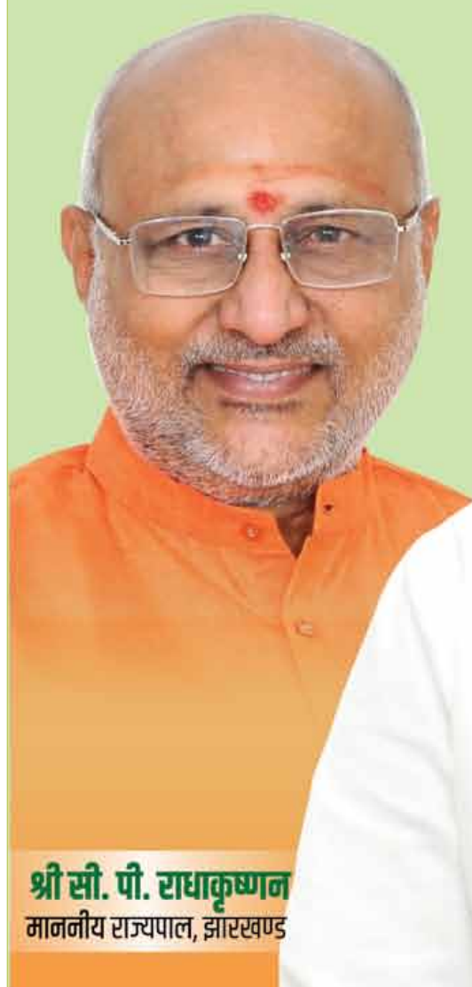
श्री सी. पी. राधाकृष्णन माननीय राज्यपाल, झारखण्ड