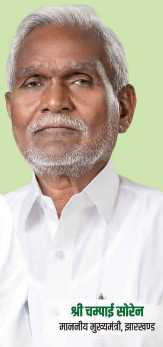
श्री चम्पाई सोरेन माननीय मुख्यमंत्री, झारखण्ड