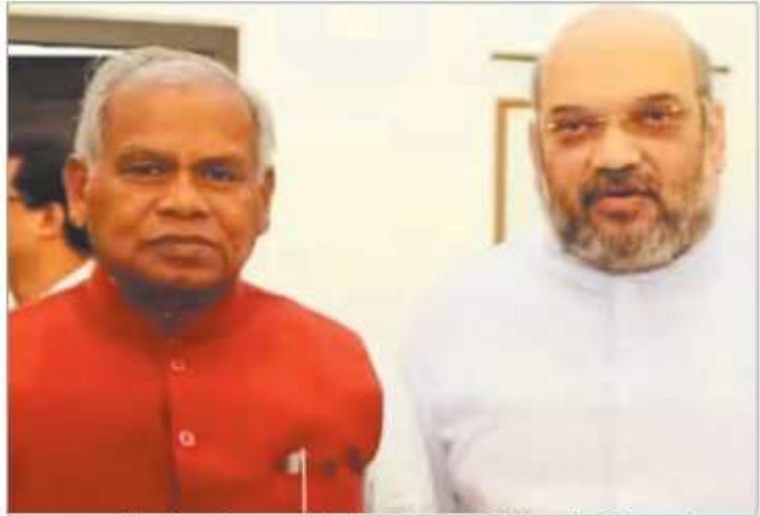
पटना, एजेंसी। बिन्दुवर्तनी आश्रम मीराबाई पार्टी सोमवार को राज्य की महागठबंधन सरकार से समर्थन वापसी का पत्र सीएम तेजस्वी यादव को सौंपेगी। पार्टी की राष्ट्रीय कार्यकारिणी की बैठक के बाद पूर्व मुख्यमंत्री

जीतन राम मांझी के नेतृत्व में सभी विधायक दोपहर बाद राजभवन जाएंगे। पार्टी ने राज्यपाल से मिलने का समय मांगा है। अभी हम के चार विधायक और एक एमएलसी हैं। इससे पहले पार्टी के राष्ट्रीय अध्यक्ष संतोष कुमार सुमन