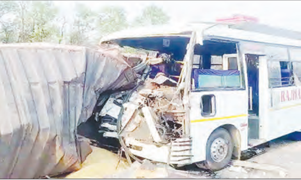
निज संवाददाता | रामगढ़

रामगढ़ जिले के चरही घाटी में एक दर्दनाक सड़क हादसा घटित हुआ, जिसमें बस और ट्रक की आमने-सामने टक्कर हो गई। इस भयावह टक्कर में दोनों वाहनों के चालकों की मौके पर ही मौत हो गई, जबकि बस में सवार करीब 15 यात्री घायल हो गए हैं। इनमें से एक मासूम बच्चे की हालत काफी गंभीर बताई जा रही है, जिसे बेहतर इलाज के लिए विशेष चिकित्सा सुविधा वाले अस्पताल में रेफर किया गया है। घटना के संबंध में मिली जानकारी के अनुसार, रंची से हजारीबाग की ओर जा रही एक यात्री बस जैसे ही चरही घाटी के पास पहुंची, सामने से आ रहा हल्दा ट्रक अचानक अनियंत्रित होकर सड़क पर पलट गया। उसी समय सामने से आ रही बस ट्रक से सीधी टक्कर मार बैठी। टक्कर इतनी जबरदस्त थी