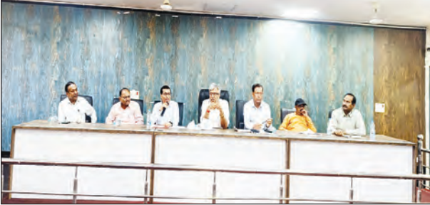
निज संवाददाता | दुमका

सियो कान्हु मुर्मू विश्वविद्यालय परिसर में मंगलवार को एक महत्वपूर्ण बैठक का आयोजन किया गया, जिसमें विश्वविद्यालय प्रशासन और सभी अंगीभूत महाविद्यालयों के प्राचार्य आमने-सामने बैठे। इस लंबे अंतराल के बाद आयोजित बैठक में कॉलेजों से जुड़ी तमाम जमीनी समस्याओं पर खुलकर विचार-विमर्श किया गया और समाधान के ठोस दिशा में पहल का भरोसा दिलाया गया। बैठक में सभी अंगीभूत महाविद्यालयों के प्राचार्यों ने अपने-अपने संस्थानों से संबंधित तमाम समस्याओं को विस्तार से विश्वविद्यालय प्रशासन के समक्ष रखा। इनमें शैक्षणिक, प्रशासनिक, वित्तीय, परीक्षा संबंधी और बुनियादी सुविधाओं से जुड़ी कई बड़ी समस्याएं