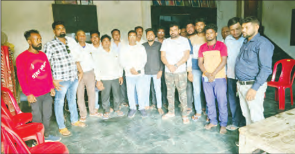
निज संवाददाता | हरिहरगंज